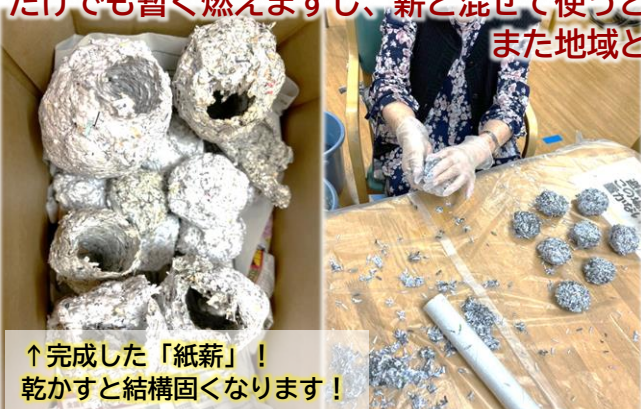
↑完成した「紙薪」！ 乾かすと結構固くなります！

近隣の避難場所と避難経路、生活の中での備えのポイント、市で行っている防災サービスにつ いて皆で確認しました。事業所でご利用者と協力して作っている「ペーパーログ(紙の薪)」も ご紹介！材料はシュレッダーと古新聞などの紙ごみのみ！水に浸したものを手で握り固めたり、 ラップ芯にきりたんぽ状にくっつけて数日乾燥させるだけで出来ちゃいます！非常時は、それ だけでも暫く燃えますし、薪と混ぜて使うと薪の節約にもなります。反響も大きかったので、 また地域と一緒に出来ることを考えていきたいと思ひます！