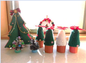
毛糸・キルティング製 クリスマスツリー