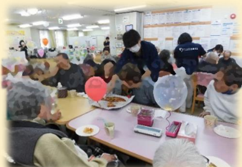
手作りくす玉でお祝いしました！