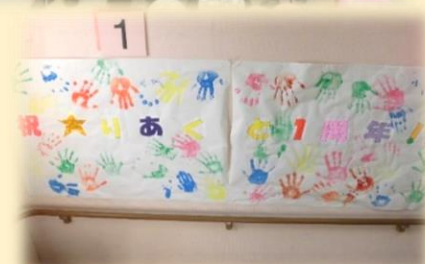
皆様に手形を押ししていただき