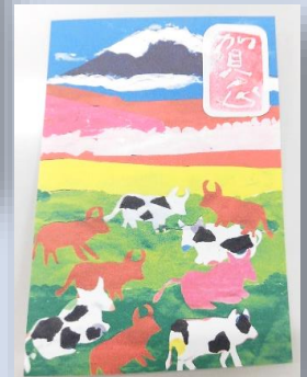
貼り絵で作った 年賀状