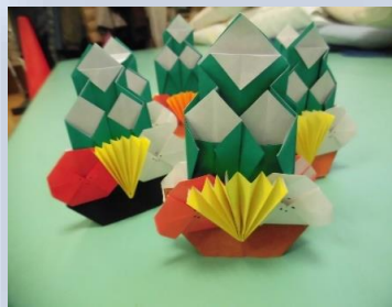
折り紙で作成した 門松