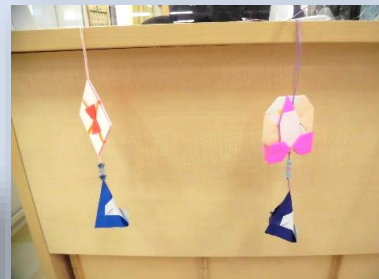
折り紙・ビーズで作成した サンタのつるし飾り